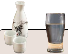
日本酒 冷熱燗 650yen