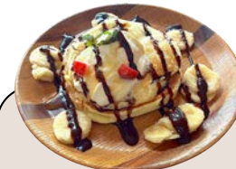
チョコバナナ パンケーキ 650 yen