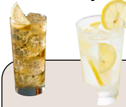
ハイボール レモンサワー 650yen