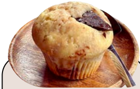
マフィン 450 yen