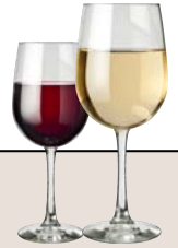
ワイン 白・赤 650yen