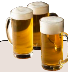
サッポロクラシック スーパードライ キリン一番搾り