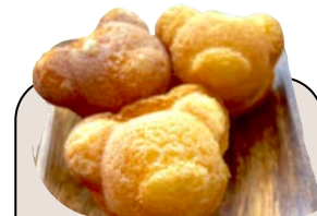
くまドレーヌ 300 yen