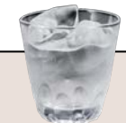
焼酎 ロック 水割り 650yen