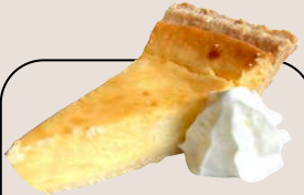
チーズケーキ 550 yen