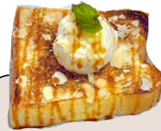
キャラメルトースト 650 yen